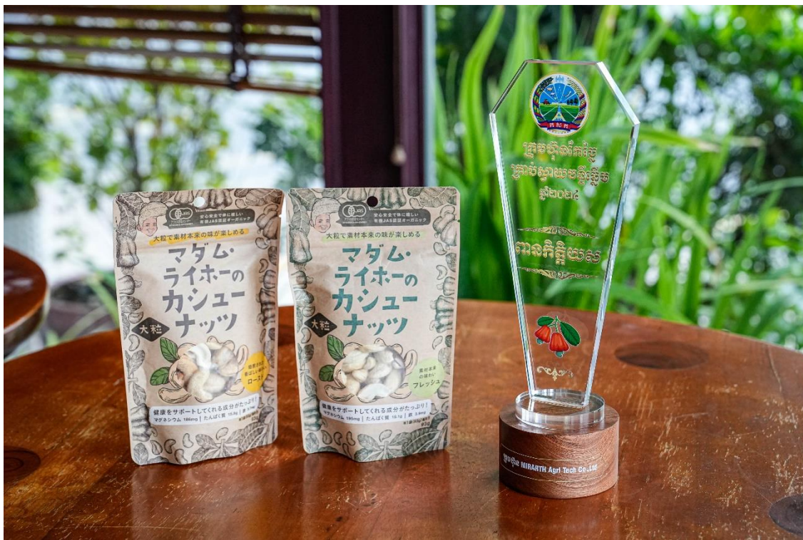
マダム・ライホーのカシューナッツ ( https://madam-laihout.jp/ )

この度、カンボジア農林水産省農業産業局主催の「Cashew Nuts Outstanding Processors Competition in 2024」にエントリーし、最終ラウンドが6月6日にプノンペンで開催され『名誉賞』を受賞いたしましたのでお知らせします。